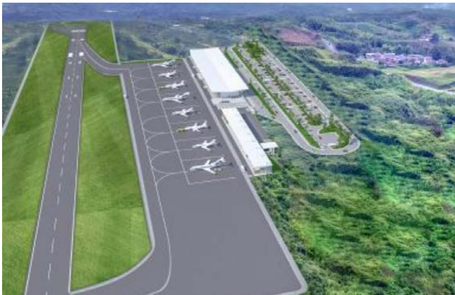
El Gobierno de Petro, anunció la construcción del aeropuerto en Palestina en Manizales.

E l país ha estado oyendo en los últimos 25 años de los dinerales que se han enterrado en el embeleo de los oligarcas pobres de Manizales para construir un aeropuerto en Palestina. A todos los presidentes los han ordeñado