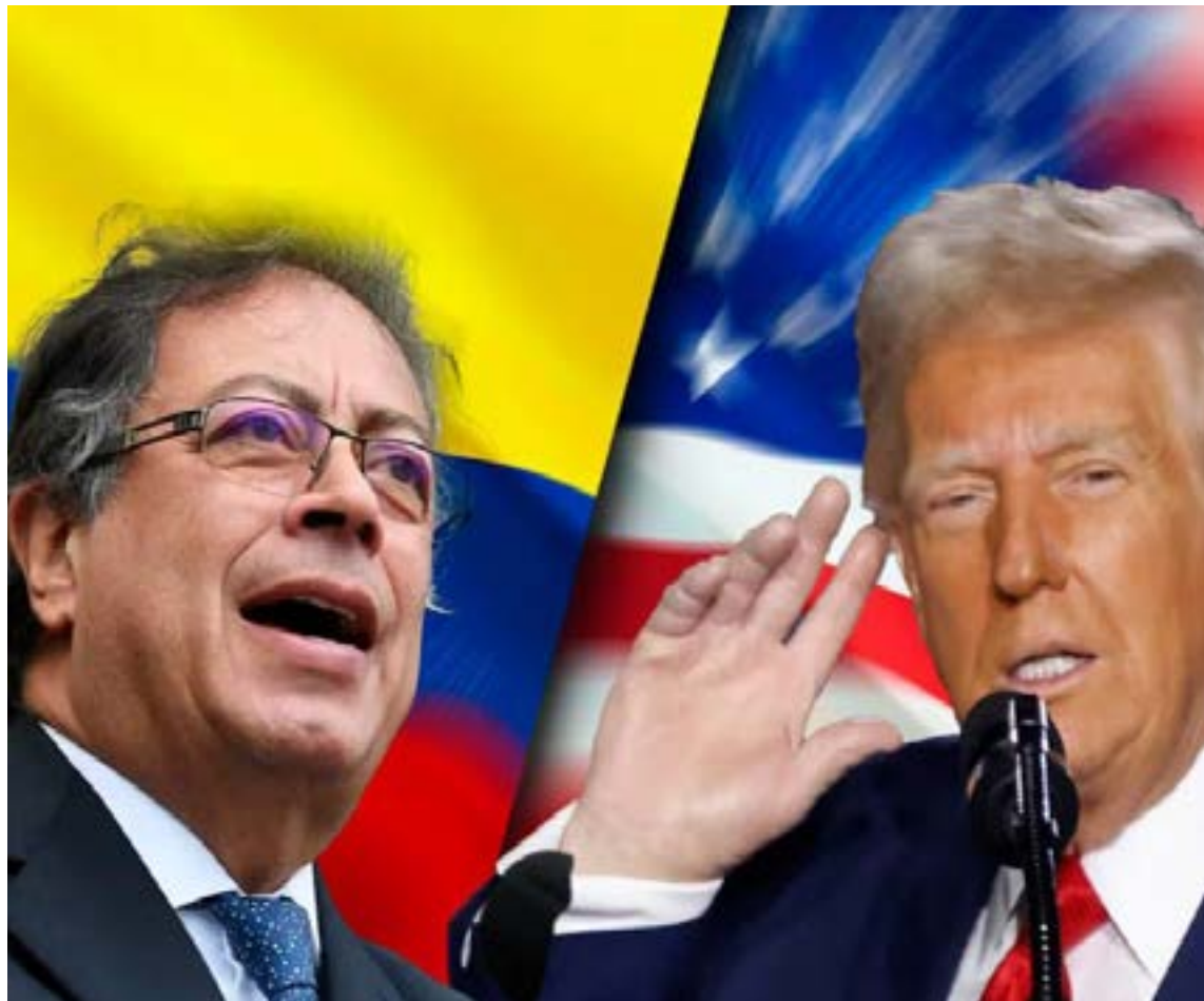
Las relaciones entre Colombia y Estados Unidos volvieron a la normalidad de aliados.

economías ilegales a las economías lícitas.