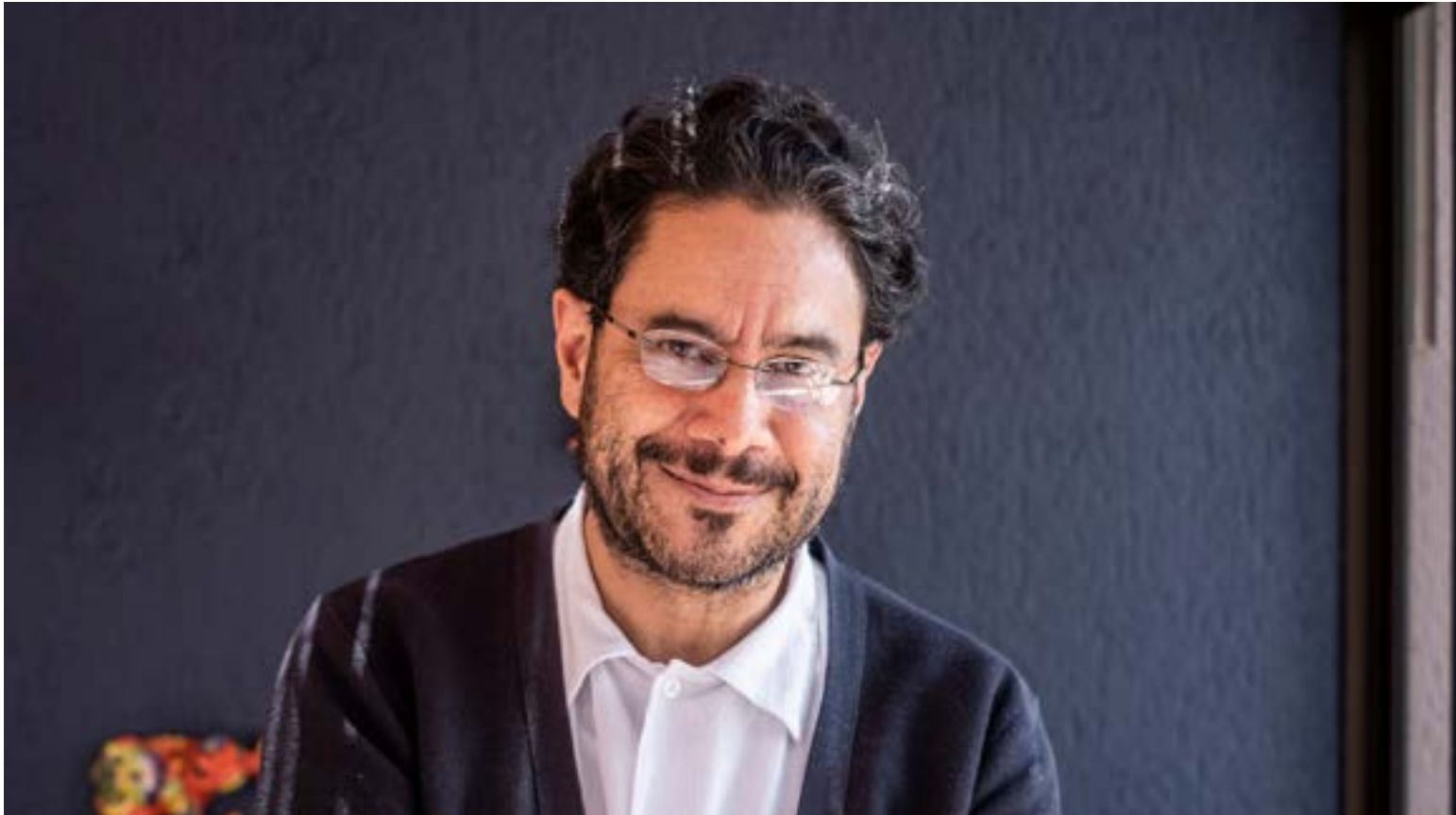
El senador de la República, Iván Cepeda, se encontraba en el punto de mira de una red delictiva que buscaba acusarlo falsamente de narcotráfico.