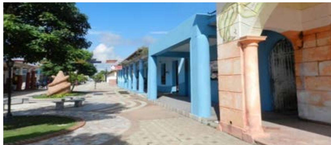
Bienvenidos a mi isla, tu isla, la isla de la juventud

—No pudo llevarme. No me atemorice. Me defendí como pude. Lo apuñalé, una, dos, tres veces y me