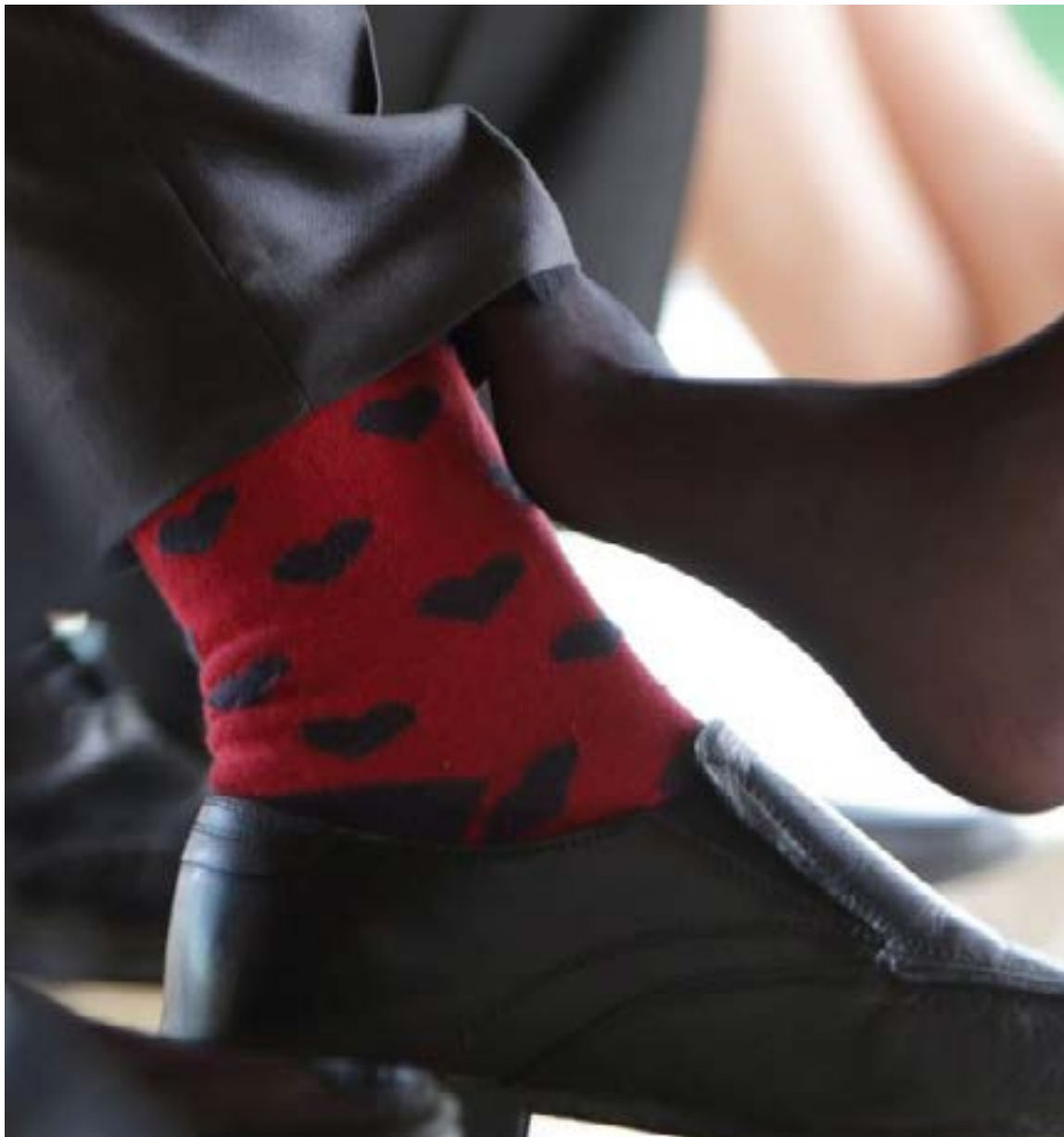
La infidelidad es pasajera, tiene un principio y un final, con diversos desenlaces.

La infidelidad empieza cuando te ponen los cuernos y no te dicen nada. Puede haber un previo que es cuando detectas que la mirada de la pareja se va hacia otras personas. Y una situación que es medianamente usual