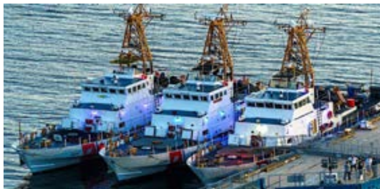
Estados Unidos donó tres embarcaciones patrulleras de largo alcance a la Armada colombiana.