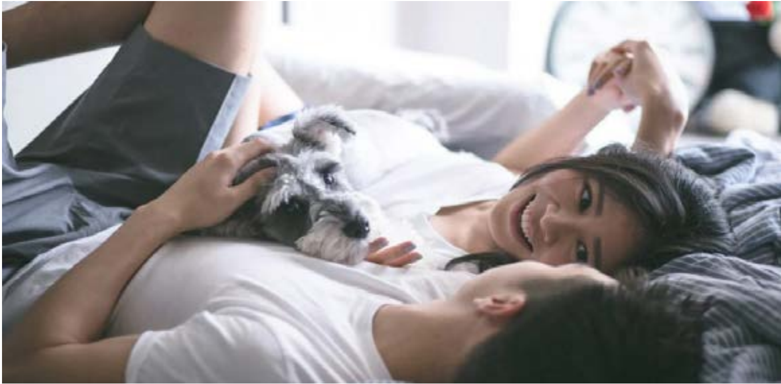
Los ratos de infidelidad.