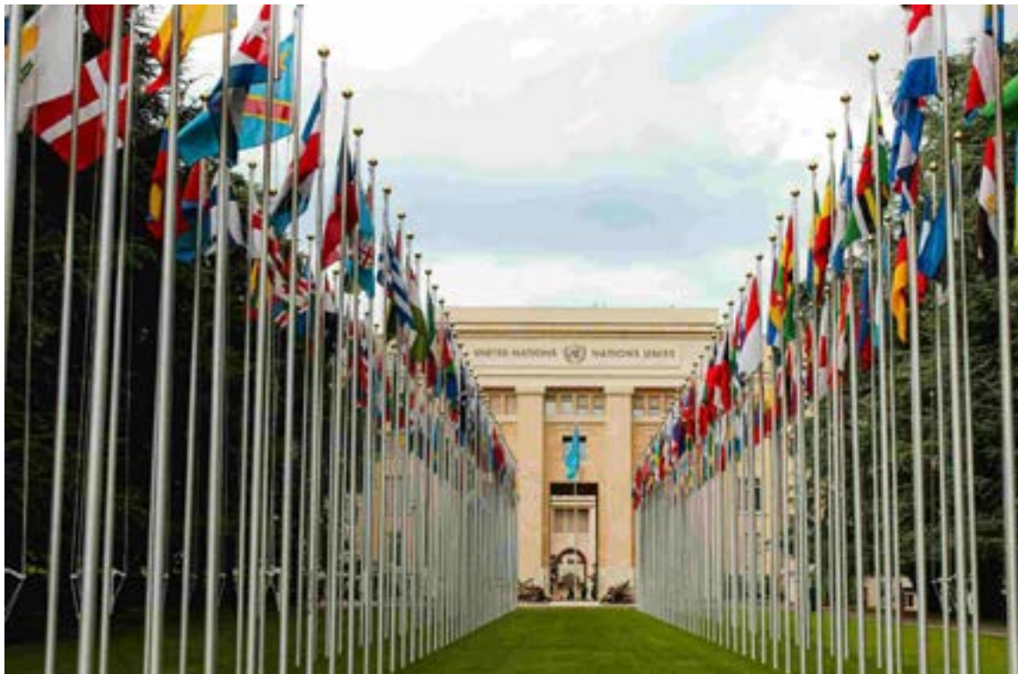
La Organización de las Naciones Unidas (ONU) ha expresado su profunda preocupación por la creciente polarización política en Colombia y ha condenado enérgicamente el reciente ataque contra el senador Miguel Uribe Turbay.

Montaje «Diego Cadena quien ha prestado sus servicios a Álvaro Uribe, estaría bus-