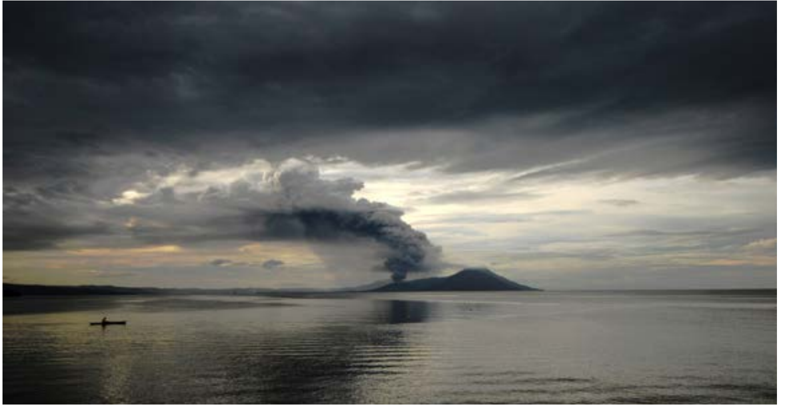
Volcán en erupción en Paúpa Nueva Guinea. El Pacífico es el de mayor actividad volcánica del mundo, y son muy conocidos sus terremotos en sus costas. A sus orillas se las refiere como el Cinturón de Fuego del Pacífico.

E l 25 de septiembre se cumplió el aniversario 511 años del descubrimiento del Océano Pacífico por parte de Vasco Núñez de Balboa en compañía del indio Panquiaco. Una muestra de los éxitos es que, si los españoles se hubieran tomado la tarea de comprender a la población nativa, hubieran llovido en la civilización por siglos de dominio español. Descubrir el Océano más grande del planeta era un hito para un pequeño país fragmentado que buscaba riquezas en ultramar.