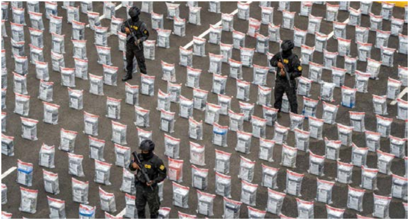
El mayor decomiso de cocaína en el mundo 9.8 toneladas procedentes de Colombia fueron decomisados en República Dominicana de propiedad del Cartel de los invisibles, que el gobierno está logrando visibilizar.

Un operativo multinacional liderado por la Armada en noviembre de 2024