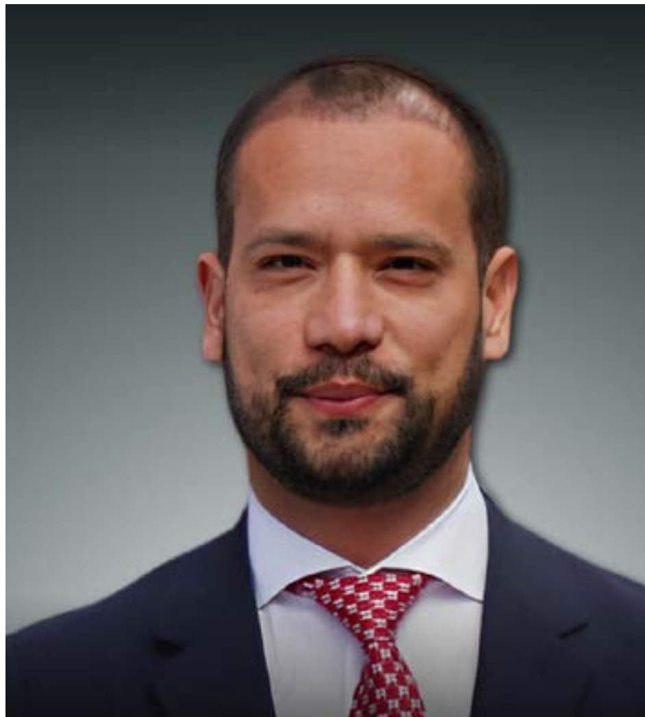
Diego Cadena, el controvertido 'abogánster' a la espera de un fallo en su juicio por soborno y fraude procesal.