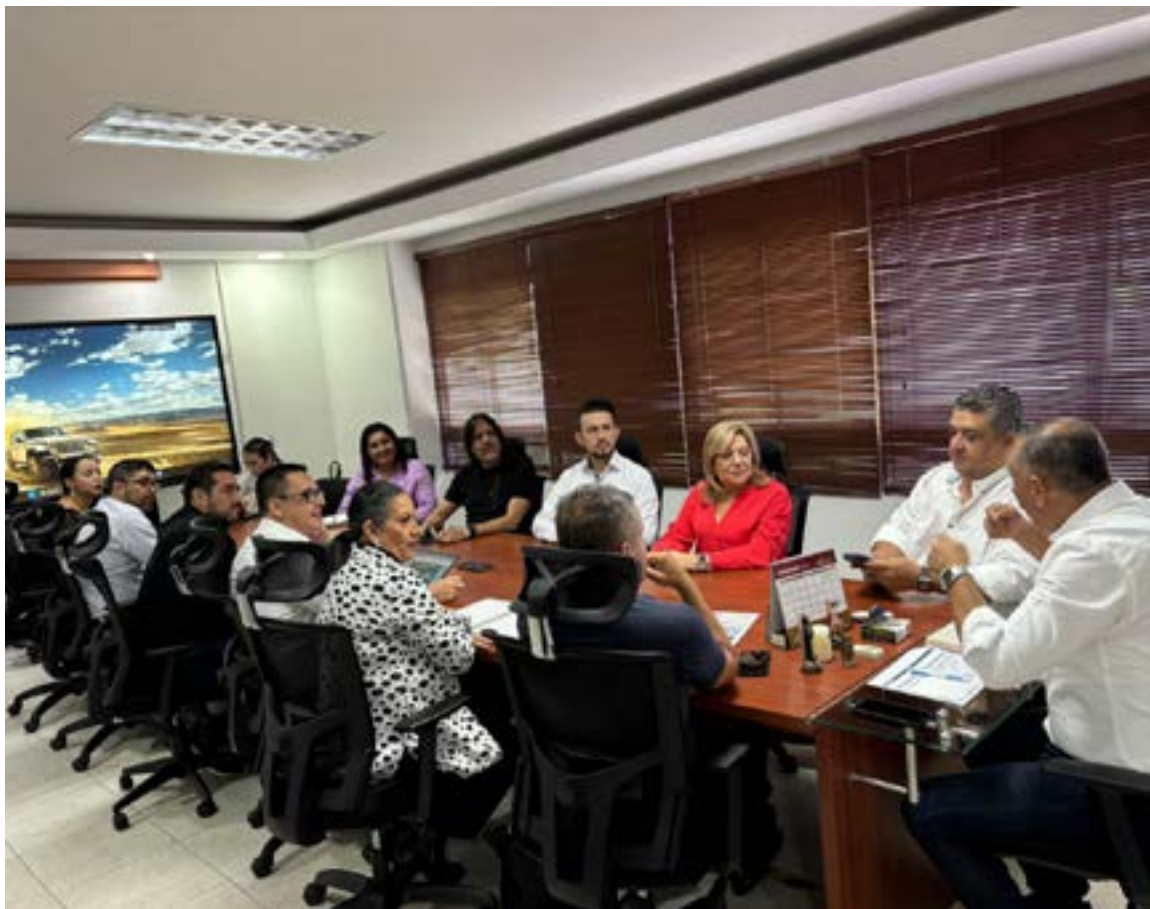
Grupo de empresarios que se han comprometido con las 24 horas en Armenia.

Hoy cuenta con una variada oferta de gastro-entretenimiento, turismo y ocio nocturno, de ahí la importancia de fortalecerla para que locales y visitantes disfruten de esta ciudad en su totalidad. Asobares Colombia, con su capítulo en el Quindío y el apoyo de la Alcaldía de Armenia y su Secretaría de Desarrollo Económico, lideran la creación de un Comité de Turismo y Gastro-entretenimiento para darle el impulso que necesita y lograr que esta ciudad también sea